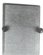
Sportello ispezione camino