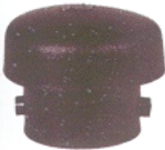
Cuffia di sfiato per serbatoi