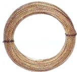
Cavetto in acciaio

Per il comando degli organi d'intercettazione a mezzo leva antincendio. Matassa da mt.50