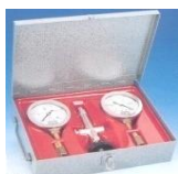
Pump test cassetta completa di rubinetto piu' manometro e vuotometro