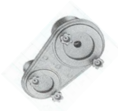
Placca fumi foro 80 50 mm