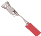
Valvola limitatrice omologata